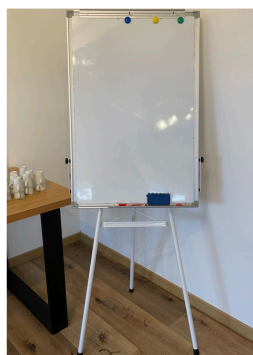
Un tableau blanc effaçable