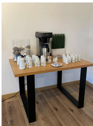
Une cafetière avec des tasses, sucres et lait au besoin