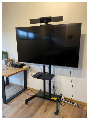
Un grand écran